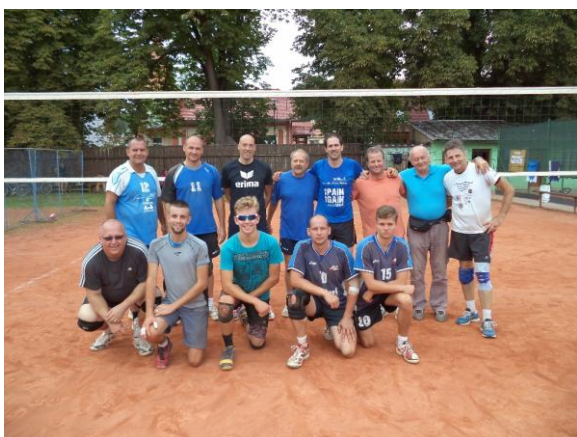
Volejbalisté B družstva Bučovic se svými německými přáteli

V sobotu 13. srpna 2016 se na našich kurtech v aleji konal přípravný turnaj mužů a žen, který nahradil tradiční družební turnaj. Skutečnost, že už téměř třicetiletou družbu s našimi německými sportovci nelze jen tak utnout, nám dokázalo mužské družstvo z Grimmy, které projevilo zájem se této naší akce také zúčastnit. Dále přijala pozvání družstva z Orlovic, Hrušek a Maref. Tuto sestavu doplnilo naše mužstvo Bučovice B. Některé zápasy ve skupině byly velmi vyrovnané, takže o pořadí na prvním místě rozhodl až vzájemný poměr setů.