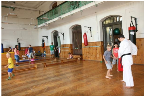
Den otevřených dveří do tělocvičny i na hřiště