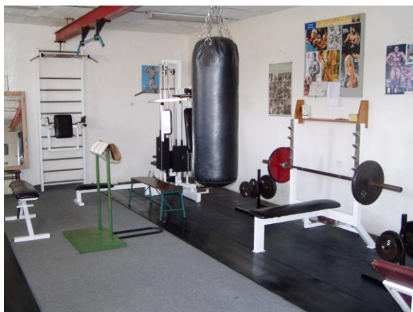
Posilovna s klasickou výbavou