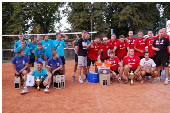
Vítěz turnaje VK Mirad Prešov (v červeném) a druhý finalista VK Ostrava

Celý turnaj se odehrál za ideálního počasí. Součástí doprovodného programu byla autogramiáda fotbalistů Zbrojovky Brno, pro děti zde byl skákací hrad a pro všechny bohaté občerstvení.